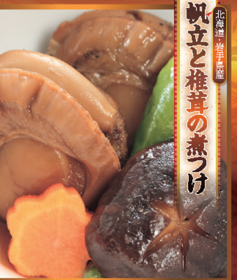
帆立と椎茸の煮つけ

種子島の大自然ゆえ生み出された稀少な安納芋を使用しています。安納芋の甘さを活かし、またしっとりとした食感を残したきんとんに仕上げました。